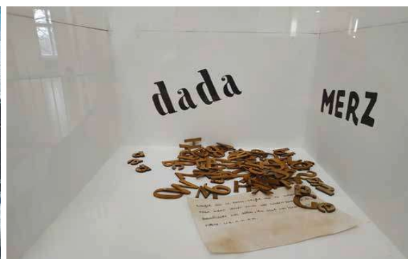
Rechts: Joachim Seinfeld, Save the Day – Kurt Schwitters (Detail), 2020, 32,7x23x32,5cm, Mixed Media © Joachim Seinfeld