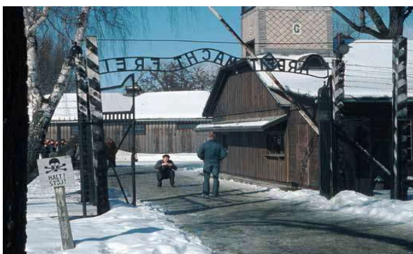
Links: Joachim Seinfeld, Souvenir Photograph , Unter dem Tor des „Stammlagers“ in der Gedenkstätte Auschwitz-Birkenau, aufgenommen zwischen 1994 und 2004