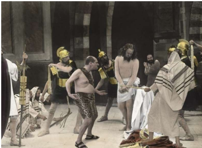
Joachim Seinfeld, Wenn Deutsche lustig sind – Dokufiktion , Oberammergau 1929: Passionsspiele; 2016, digitaler Silbergelatineprint auf Baryt, gerahmt, 40x50 cm

In seiner dritten Position für Aliens Anywhere nutzt Joachim Seinfeld das moderne Künstlerbild als Ziel für seinen kritischen Humor. Einst als visionärer Schöpfer verklärt, blieb dieses Bild lange Männern vorbehalten, während Frauen als Musen galten. Ihre Anerkennung war hart erkämpft. Die Werkgruppe Save the Day greift dieses problematische Künstlerbild auf und dekonstruiert es durch (halb-)fiktionale Inszenierungen vermeintlicher Eingebungsmomente. In dioramaähnlichen Installationen inszeniert er ikonische, aber ironisch gebrochene Momente der Kunstgeschichte – von Schwitters bis Beuys – und hinterfragt so spielerisch den Mythos des Genies.